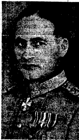
Kenraali Hugo Osterman, sotaväen päällikkö.

30. 11. ja 1. 12. oli vihollisen ilmavoimien toiminta hyvin vilkasta. M.m. suorittivat viholliset lentäen molempina päivinä pommihyökkäyksiä Helsinkiin, Viipuriin ja useihin muihin Suomen kaupunkiin ja asutuskeskuksiin, jossa ne rauhansopimuksen kehuksessa tuottivat suurta aineellista tuhoa ja vaativat lukuisia ihmisiä uhreja. Lisäksi ampuivat vihollisen lentäjät konekivääreillä siviiliväestöä. Mitään sotilaallisia kohteita pommitukset eivät vaurioittaneet, lukuunottamatta pieniä tilapäisiä kaatuneita rautatieliikenteessä. 2. 12. ei ollut mainittavampaa vihollisen ilmatöimintää. Omat ilmavoimat ovat suorittaneet vain suunnitelman mukaisia tiedustelu- ja torjuntalentoja. Vihollisen lentokoneista ovat ilmavoimamme tai ilmatorjuntajoukkomme ampueneet alas tai pakottaneet laskeutumaan yhteensä 24 konetta. Omat tappiot ovat kaksi tuhoutunutta lentokonetta.