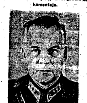
Kenraali Aarne Sihvo, väestönsuojelun päällikkö.