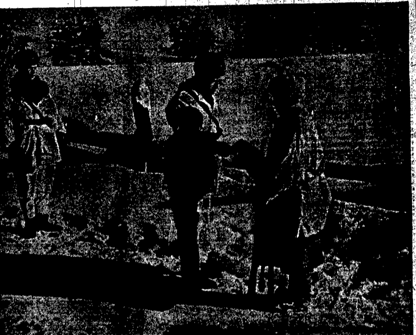
Alikers. Simo Höyhä, joka on kiväärillä ampunut 219 vihollista ja koneaseilla ainakin yhtä paljon saa divisioonansa komentajalta Ruotsista tulleen erikoiskiväärin lahjakirjoineen.

Shanghai, Berliin kautta, 6. 3. (STT) Japanilaisia joukkoja laukottu tiistaina maahan Tongkassa, joka sijaitsee lyhyen matkan päässä Makaosta. Pöytäkirjassa kuultuun tuntekoti kaksi osastoa, kummi pöytäkirjassa kiinalaisten ankarasta vastarinnasta huolimatta ja ne uhkaavat nyt Makaosta sikäläisille johtavaa pöytäkirjailijaa. Tuhansia kiinalaisia pakolaisia on saapunut Makaon.