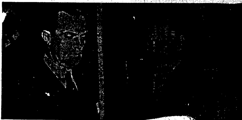
Suomi maksaa velkansa. Kuvassa nähdään ministeri Hj. Procopé ojentamassa shekkiä Yhdysvaltain rahaministerille Morgenthauille Suomen velkaosuuden maksuksi. Shekki oli tällä kertaa 234,393 dollarin suuruinen.