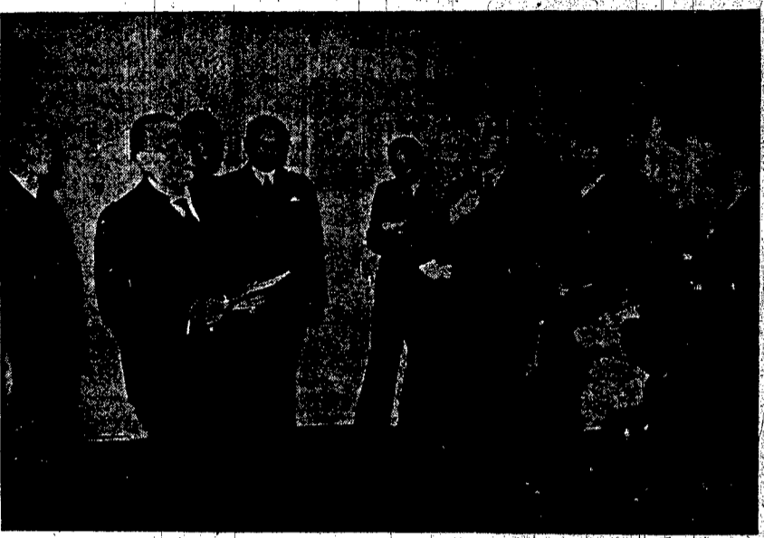
Tasavallan presidentti puhuu esonalehtimiehille.

Lontoo, 12. 1. (STT) Etelä-Amerikan rannikon edustalla on ollut uusi meritaistelu. Daily Telegraph ja Daily Mail julkaisivat tapahtumasta uutisen kello saaneensa kuulla, että brittiläinen risteilijä Achilles olisi toisapäivänä joutunut taisteluun saksalaisen sotalaivan kanssa Brasilian laustausastaman edustalla. Daily Mailin New Yorkin-kirjeenvaihtaja arvelee, että uusi meritaistelu pian on odotettavissa Etelä-Amerikan rannikon edustalla. Hän huomauttaa, että saksalaiset sotajäivät ovat valmistautuneet saattamaan 13 saksalaista kauppalaa, jotka ovat saaneet määrärahan lähtien toimittamaan Etelä-Amerikan satamille pois.