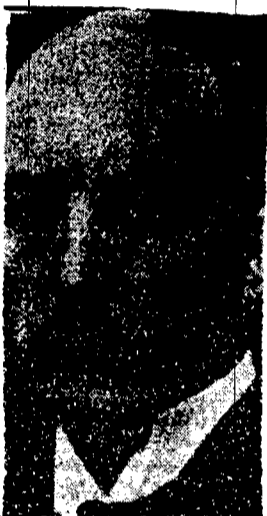
Pääministeri Risto Rytli.

Rauhan tekeminen vaatii usein suurempaa rohkeutta ja suurempaa aloitustyötä kuin sodan aloittaminen. Ennen sodan puhkeamista voidaan tavallisesti sekä omat että vihollisen voimavarat ja niihin perustuvat mahdollisuudet ja riskit arvioida joltisellakin varmuudella ja sen mukaan, kuinka suureksi tämä arviointi osoittaa riskit, voidaan myöskin laskea se uhrausten raja, johon kannattaa sodan välttämiseksi mennä. Sitä vastoin sodan keerran puhjettaessa kukaan ei ole omissa mielessään kukaan. Siihen sisältyy aina yllätyksiä. Läheskään kaikkia tekijöitä ei voida arvioida ja laskea samalla tarkkuudella kuin rauhan aikana.