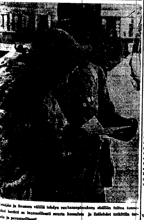
Venäjä ja Suomen välillä tehdyn rauhansopimuksen sisällön tultua tunnetuksi herätti se huomattavasti suurta huomiota ja läheiset tutkittiin tarkoin ja perusteellisesti.