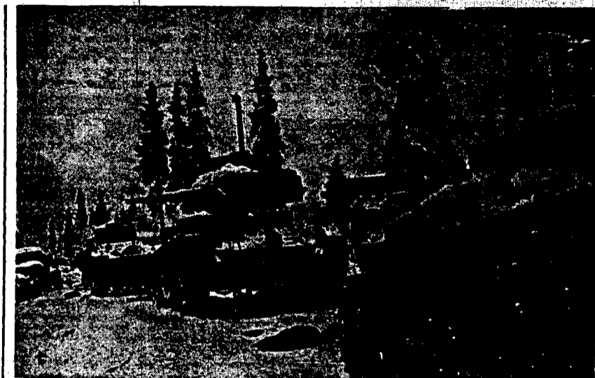
Tällaiselta näytti Suomussalmella sen jälkeen kuin vihollisen 44. divisioonaa oli työtty.

Ottawa, Reuterin kautta, 24. 1. (STT) Kanadan hallitus on kieltänyt vehnän viennin Neuvostoliittoon. Neuvostoliitto ei siis tule saamaan hehtolain osetta 1,25 milj. bushelin vehnää.